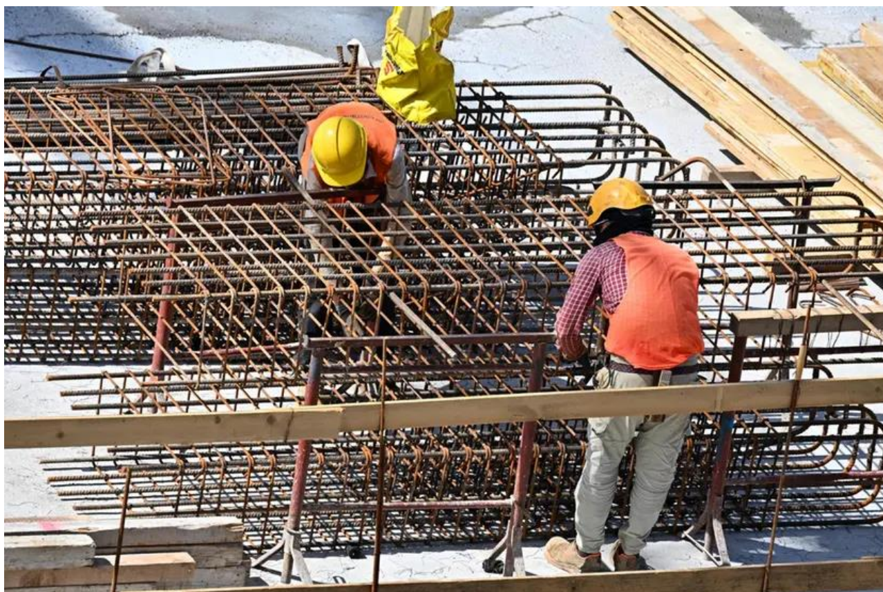
Operai al lavoro in un cantiere

Oltre il 63% delle gare di importo superiore a 1 milione ad aziende del resto d'Italia o internazionali